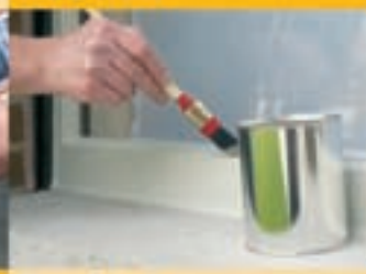
Perfect over- schilderbaar