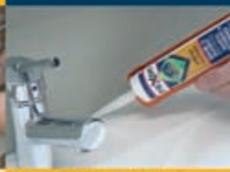
Badkamer en keuken