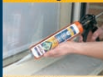
Opspuiten van glas